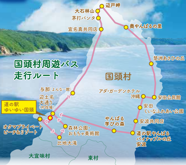
国頭村周遊バス 走行ルート