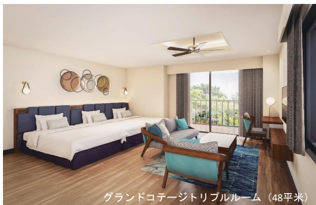
グランドコテージトリプルルーム (48平米)