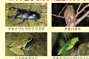
オキナウヒラタクワガタ アオバズク ハナサキガエル オキナウヘリグロツツムシ