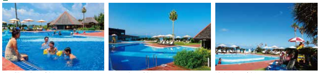
お子様用プール(水深50cm) メインプール(水深120cm～150cm) 流水プール(水深120cm)