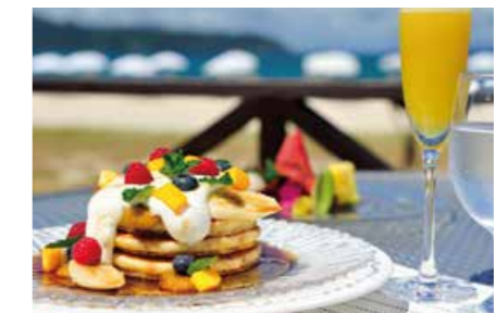
潮風のパンケーキ

※山原(やんばる)とは、「山々が連なり、森が広がる地域」という意味をもち、沖縄本島北部(名護以北)おもに国頭村・大宜味村・東村を指す言葉です。