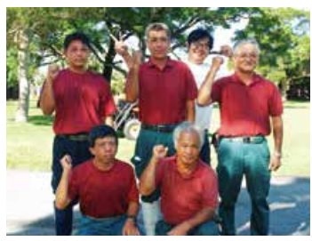
私たちが「オクマ農園」と、施設内すべての造園を担当しております。お気軽にお声かけください！