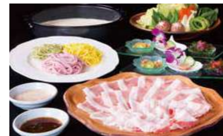
琉球豚のしゃぶしゃぶ