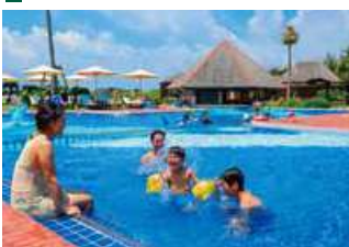
お子様用プール(水深50cm)