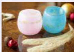
■ギフトショップ ブーゲンビリア

南国リゾートのクリスマス。ギフトショップ ブーゲンビリア、プティック プルメリアでは、華やかなクリスマスの装飾で皆さまのお越しをお待ちしております。大切な方へのクリスマスプレゼントに、琉球ガラスのペアグラスや沖縄素材のペアアクセサリーなどはいかがですか?