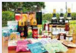
■ギフトショップ ブーゲンビリア