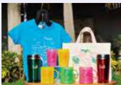
■プティック プルメリア

ギフトショップ ブーゲンビリアでは、沖縄県内で生産された選りすぐりの食品をメインにフェアを開催いたします。プティック プルメリアでは、オクマオリジナルの商品をメインにラインナップ。旅の記念に沖縄の「いいもの」をお持ち帰りください。