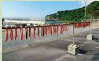
宜名真漁港 天日干し風景

11月に入ると、国頭村宜名真で行われるフーヌユー漁。フーヌユーとはシラの事で、北風が吹くこの季節にしかできない漁です。水揚げされたシラは、三枚におろされ、身に塩をすりこみ天日干して長期保存できるように加工されます。その三枚におろされたシラがすだれのように干される様子は、この時期の国頭村の風物詩となっています。