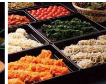
ミニビュッフェ ナムル