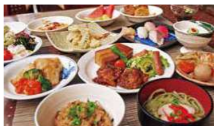
ビュッフェイメージ