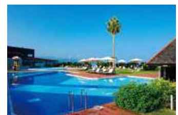
メインプール(水深120cm~150cm)