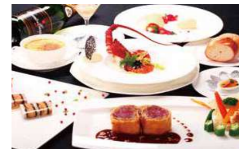
クリスマス スペシャルディナー