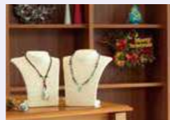
■プティック プルメリア