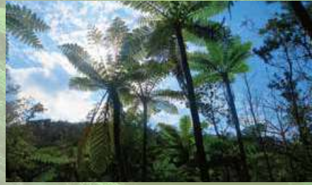
やんばるの森風景

沖縄の長～い夏の終わりを告げる北よりの季節風、『新北風(みーにし)』。この風が吹き始めると、過ごしやすい沖縄の秋が始まります。11月～12月にかけての沖縄は、まだ温かくアクティブに動きやすい季節。観光にアクティビティにと、この季節ならではの滞在をお楽しみください。