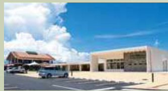
やんばる3村観光連携拠点施設