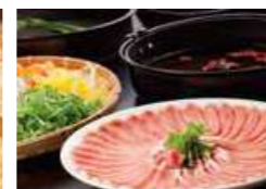
しゃぶしゃぶコーナー