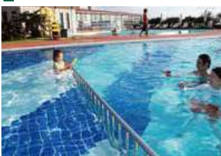
お子様用プール(水深50cm)