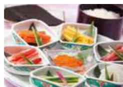
手巻き寿司コーナー

和牛のローストビーフ、揚げたて天婦羅コーナー、手巻き寿司コーナー、しゃぶしゃぶコーナー、キッズコーナー、パティシエスイーツコーナー