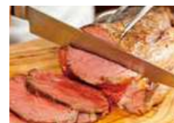
和牛のローストビーフ