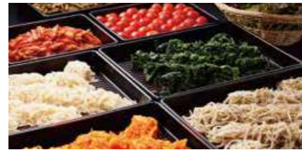
ミニビュッフェ ナムル