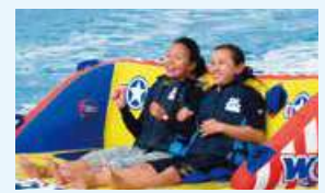
ジャイアントツブバ