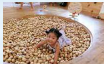
ヤンバルクイナのたまごのプール