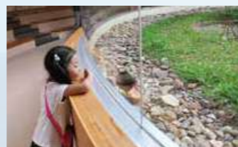
ヤンバルクイナ生態展示学習施設