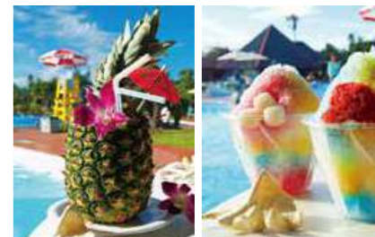
まるごとパイナップルカクテル

オリオン生ビール …… ¥480 泡盛 山原くいな25度 …… ¥480 オリジナルカクテル …… ¥480~ グラスワイン(赤・白) …… ¥480 ミックスナッツ …… ¥340 シーフードマリネ …… ¥750 まるごとパイナップルカクテル… ¥1,500 など