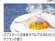
ロブスターと近海魚のTSUTSUMU仕立て サフランの香り

■会場/ SUNSET ■営業時間/18:00~21:00 ■受付/レストラン予約【内線 2301】