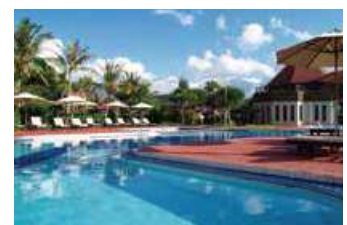
メインプール(水深120cm~150cm)