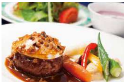
和牛のハンバーグステーキやんばるキノコ入りワインソース