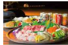
ジョウトーコース ※ドリンクは含まれません