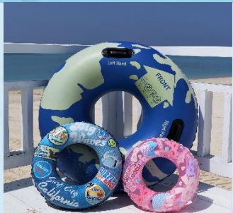
浮き輪 2時間¥600 4時間¥1,200