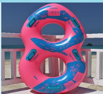
ツインチューブ 2時間¥1,200 4時間¥1,800