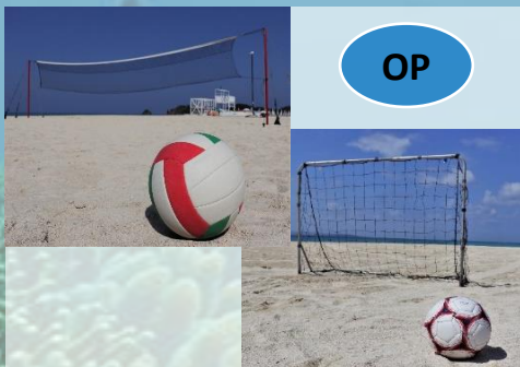
ビーチバレー ・ サッカー 1時間¥2,000