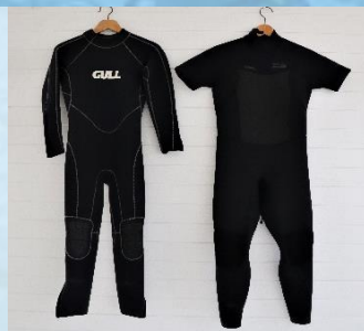
ウェットスーツ 1時間¥800 1日¥1,500