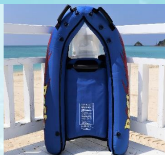
シュノーケリングボード 1時間¥1,800