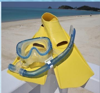
シュノーケリング3点セット 1時間¥2,000