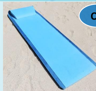
フローターマット 1日 ¥1,500