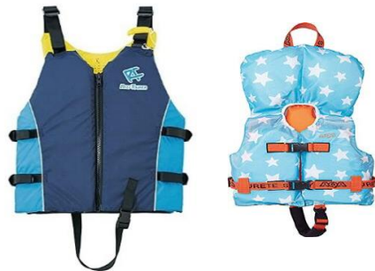
ライフジャケット ビーチ遊泳区域にてご利用 無料