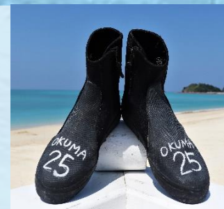
マリンシューズ 1日¥800