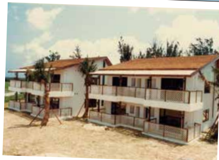
1982年 コテージ (現メインコテージデラックス)