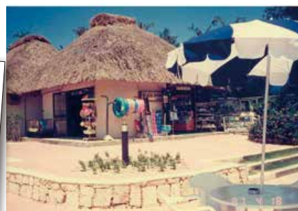
1987年 ビーチショップ (現アロマセラビーチサロン)