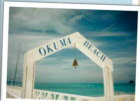
1998年 カランカランの鐘