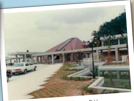
1984年 フロントロータリー