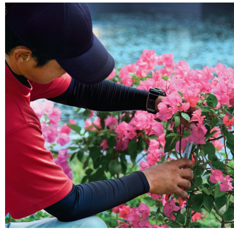
昨年2月から1,500本のブーゲンビリアを植栽