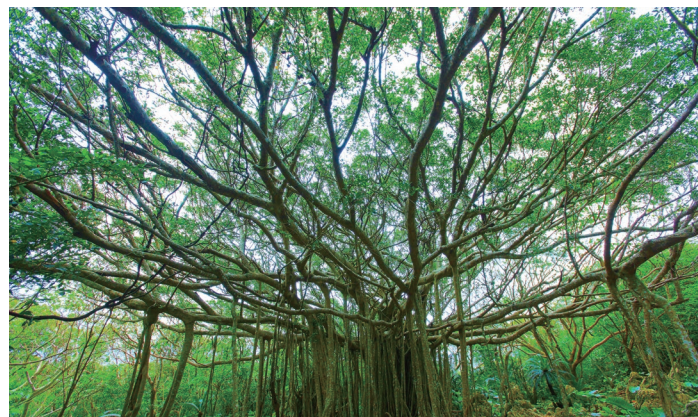
直径約120メートルの巨大な聖木「御願ガジュマル」