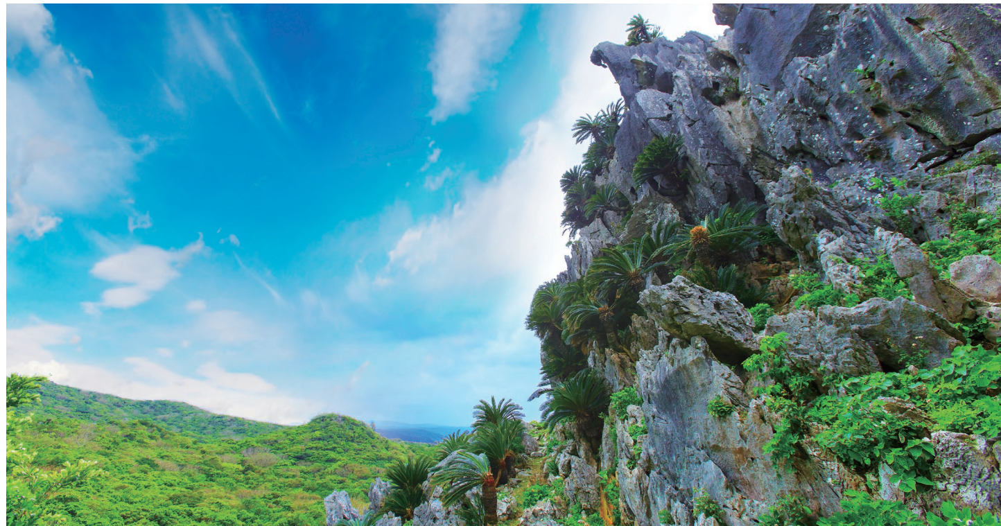
沖縄の自然・地歴・信仰に触れられる『大石林山』。展望台からは、やんばるの大自然を望むことが出来る ※写真はスピリチュアルガイドツアーコース