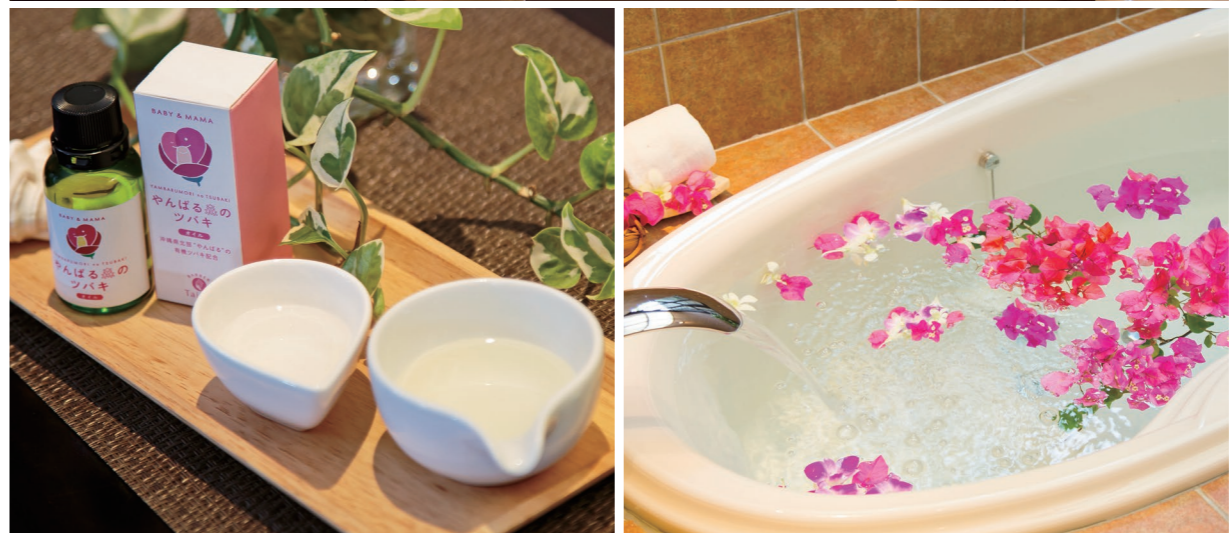
上)喧騒から離れた空間。カップルでもご利用可 左)有機JAS認定の国産椿油 右)「トータルバランスコース」ではフラワーバスもご用意