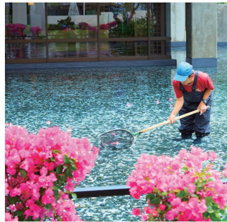
敷地内の落ち葉やゴミを拾い、いつでも美しく