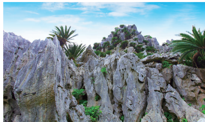
大石林山の岩山に6万本以上のソテツが共生している

施設情報 大石林山 TEL:0980-41-8117 住所:国頭村宜名真1241 営業時間: [10月~3月] 9時~16時(17時30分閉園) [4月~9月] 9時~17時(18時閉園) 定休:年中無休 P:80台 入館料:大人820円 小人520円 スピリチュアルガイド:大人3,000円 小人2,200円