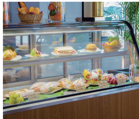
選ぶのが楽しいカラフルなショーケース