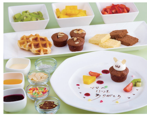
<夏休み限定スイーツ> 自由に飾ってオリジナルのスイーツを