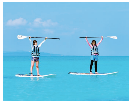
スタンドアップパドルボード