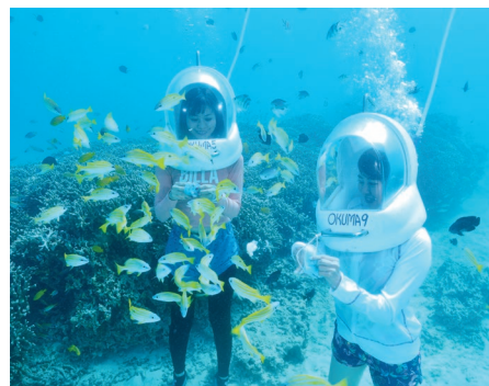
マリンウォーカー