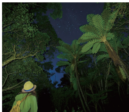
「夜の生き物探索ツアー」はオクマで人気のナイトツアー