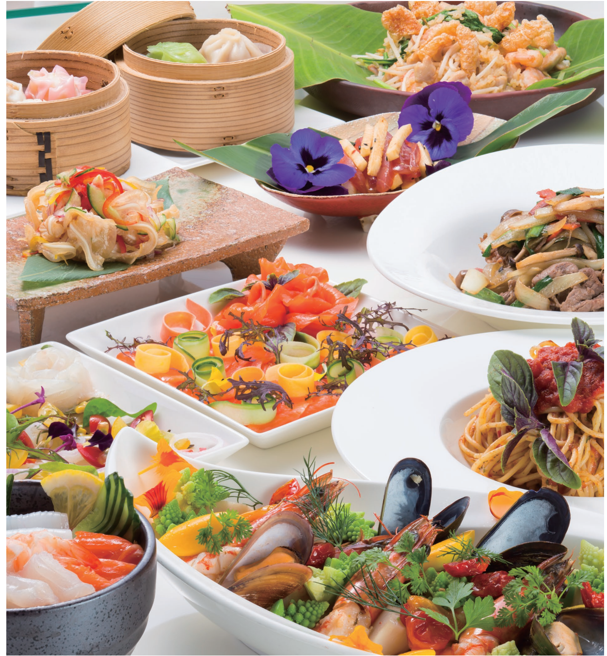
日本料理、イタリアン、フレンチ、アジア料理、中華、韓国料理など、世界各国の味がずらり。ディナータイムの「ワールドビュッフェ」

個性豊かな6タイプの楽園ダイニングで シェフの技と厳選食材が奏でる華やかな食の饗宴を