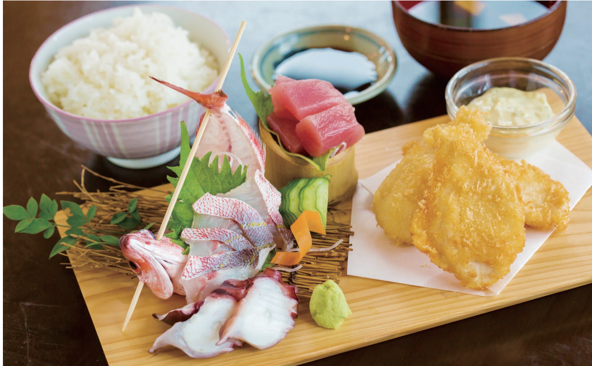
「刺身三点盛と地魚フライセット」1,200円。ランチはサラダバー付