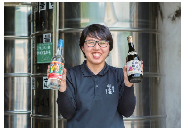
見学終了後には、泡盛の試飲もご用意