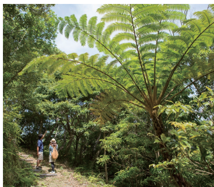
森を熟知したオクマスタッフがご案内する「やんばるの森探検ツアー」を開催

森の中のトレッキングは、森を知り尽くしたガイドと歩くのがおすすめです。当ホテルでは、国頭村の森林セラピーロードにてエコツアーを開催。何気なく通り過ぎてしまいがちな場所も、ガイドと一緒に、そこに思いつく動植物や人々の暮らしが見えてくるでしょう。沖縄本島最大級のマンングローブをカヤックで探検するツアーも人気です。