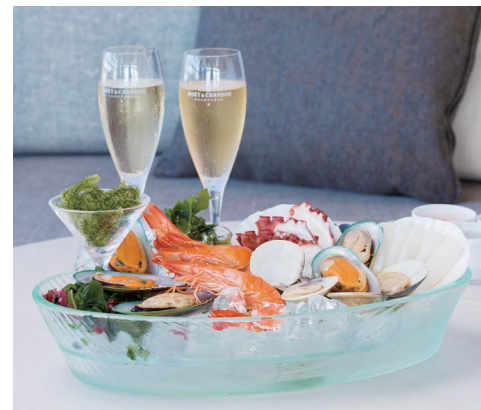
新鮮魚介を3種のソースで味わう「シーフードプラッター」