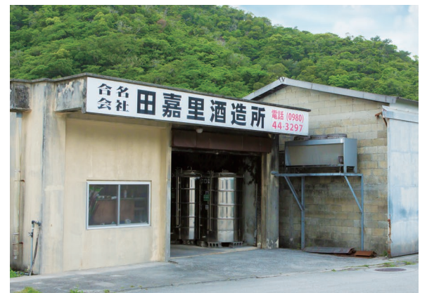
山々に囲まれ佇む小さな酒造所

施設情報 田嘉里酒造所 TEL:0980-44-3297 住所:大宜味村田嘉里417 営業時間:9:00~17:00 (見学10:00~12:00、14:00~16:00) ※見学は要事前予約 定休:日曜、第2・第4土曜 P:3台