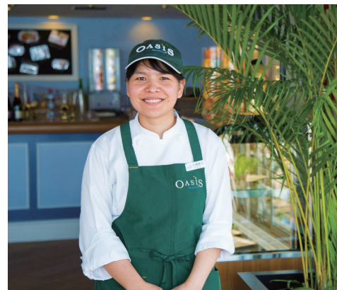
大城シェフが女性ならではのメニューを考案