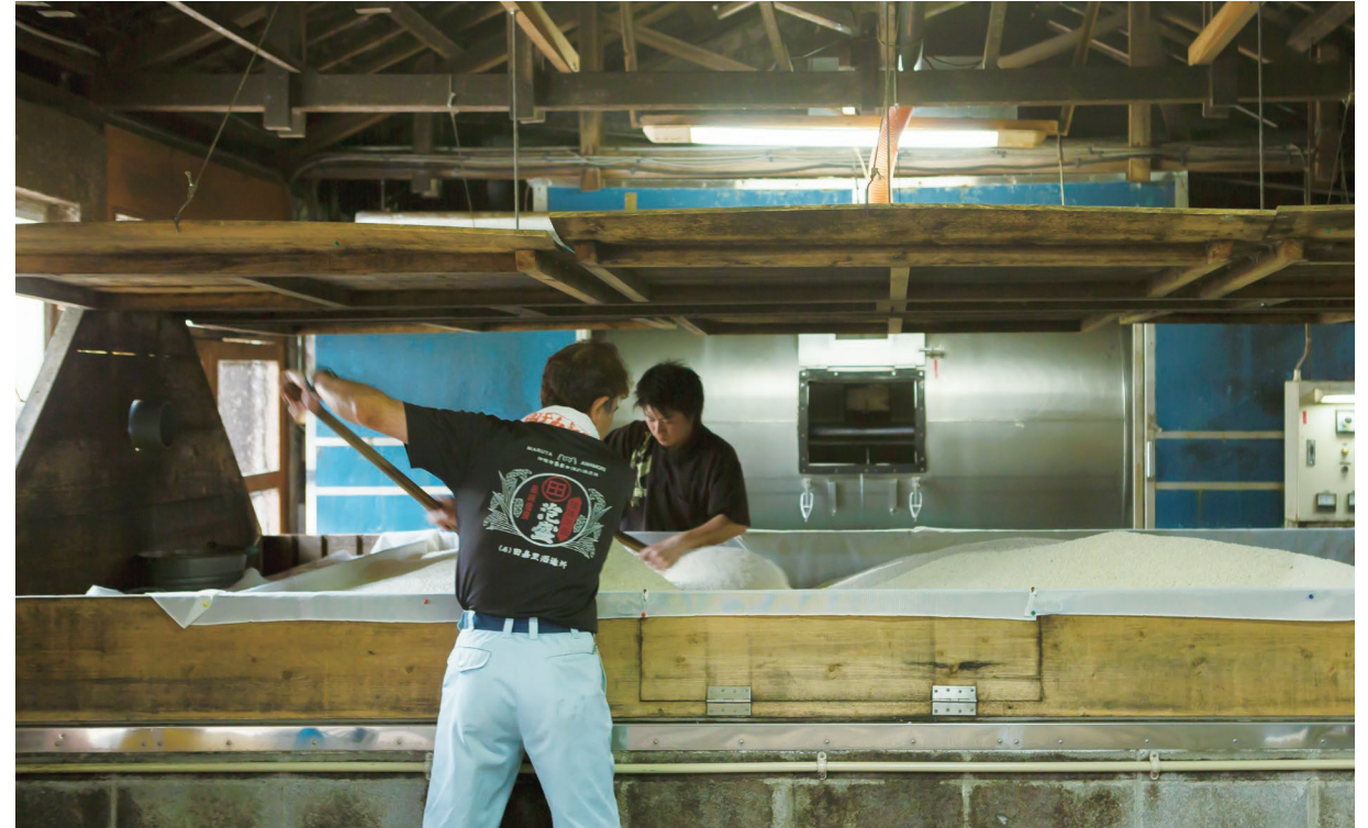
ゆっくり時間と愛情をかけて手作りされる田嘉里酒造所の泡盛