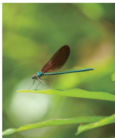
美しい金緑色に輝く「リュウキュウハグロンボ」や日本最大のシダ植物「ヒカゲヘゴ」など、亜熱帯の森ならではの動植物に出会える