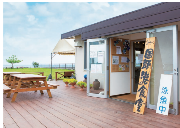
潮の香りに包まれた漁港内。テラス席もある

施設情報 国頭港食堂 TEL:0980-50-1660 住所:国頭村浜477-1 営業時間:11:30~14:30 17:30~22:00 (日曜・祝日は11:00~16:00) 定休:木曜 P:あり