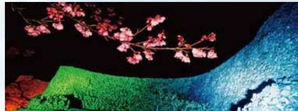
今帰仁グスク桜まつり