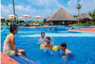
お子様用プール(水深50cm)