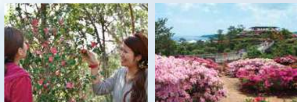
国頭村森林公園のツバキ 東村つつじ祭り