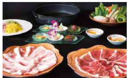
琉球豚&やんばる猪豚