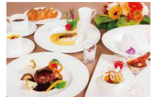
コースディナー イメージ