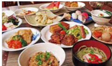
ビュッフェイメージ