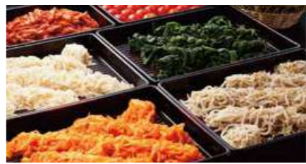
ミニビュッフェ ナムル