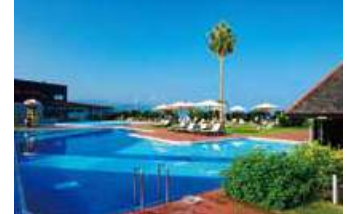
メインプール(水深120cm~150cm)