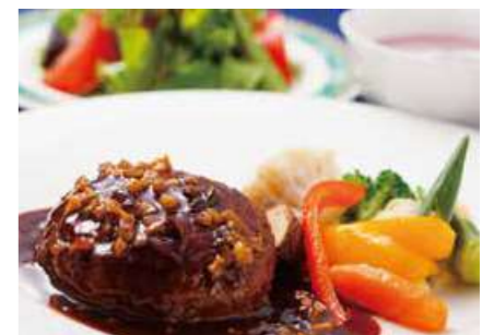
和牛のハンバーグステーキやんばるキノコ入りワインソース