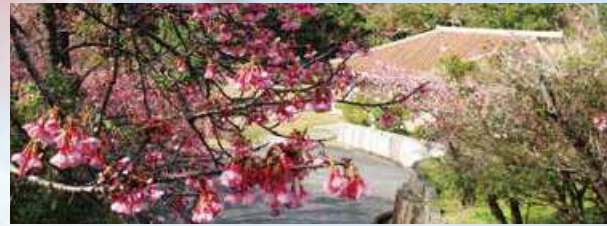
國場幸太郎記念館