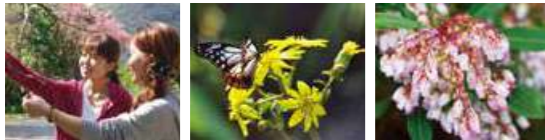
ツツブキ リュウキュウアセビ