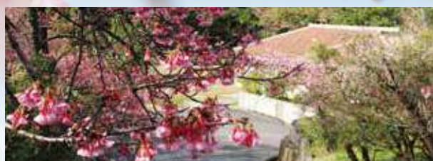
国場幸太郎記念館