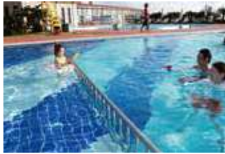
お子様用プール(水深50cm)