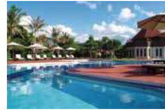
メインプール(水深120cm~150cm)