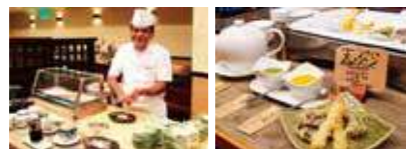
★実演コーナー(寿司、天ぷら)