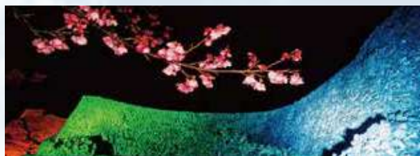
今帰仁グスク桜まつり