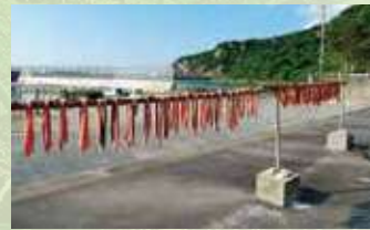
宜名真漁港 天日干し風景

11月に入ると、国頭村宜名真で行われるフーヌユー漁。フーヌユーとはシラの事で、北風が吹くこの季節にしかできない漁です。水揚げされたシラは、三枚におろされ、身に塩をすりこみ天日干して長期保存できるように加工されます。その三枚におろされたシラがすだれのように干される様子は、この時期の国頭村の風物詩となっています。