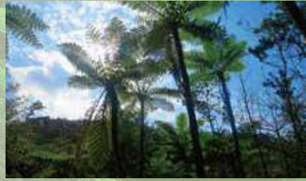
やんばるの森風景

沖縄の長～い夏の終わりを告げる北よりの季節風、『新北風～みーにし～』。この風が吹き始めると、過ごしやすい沖縄の秋が始まります。10月～12月にかけての沖縄は、まだ温かくアクティブに動きやすい季節。観光にアクティビティにと、この季節ならではの滞在をお楽しみください。