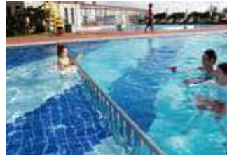
お子様用プール(水深50cm)