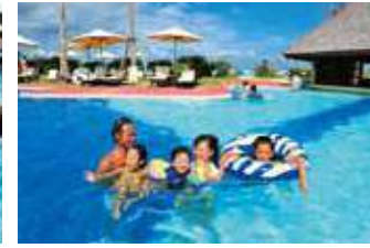
メインプール(水深120cm~150cm)