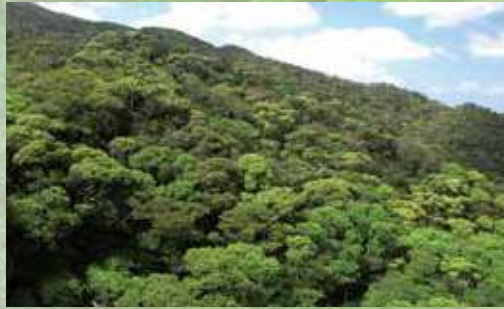
ブロッコリーの森