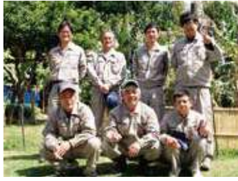
私たちが「オクマ農園」と、施設内すべての造園を担当しております。お気軽にお声かけください！