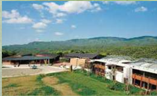
やんばる学びの森