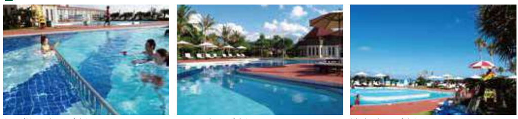
お子様用プール(水深50cm) メインプール(水深120cm~150cm) 流水プール(水深120cm)